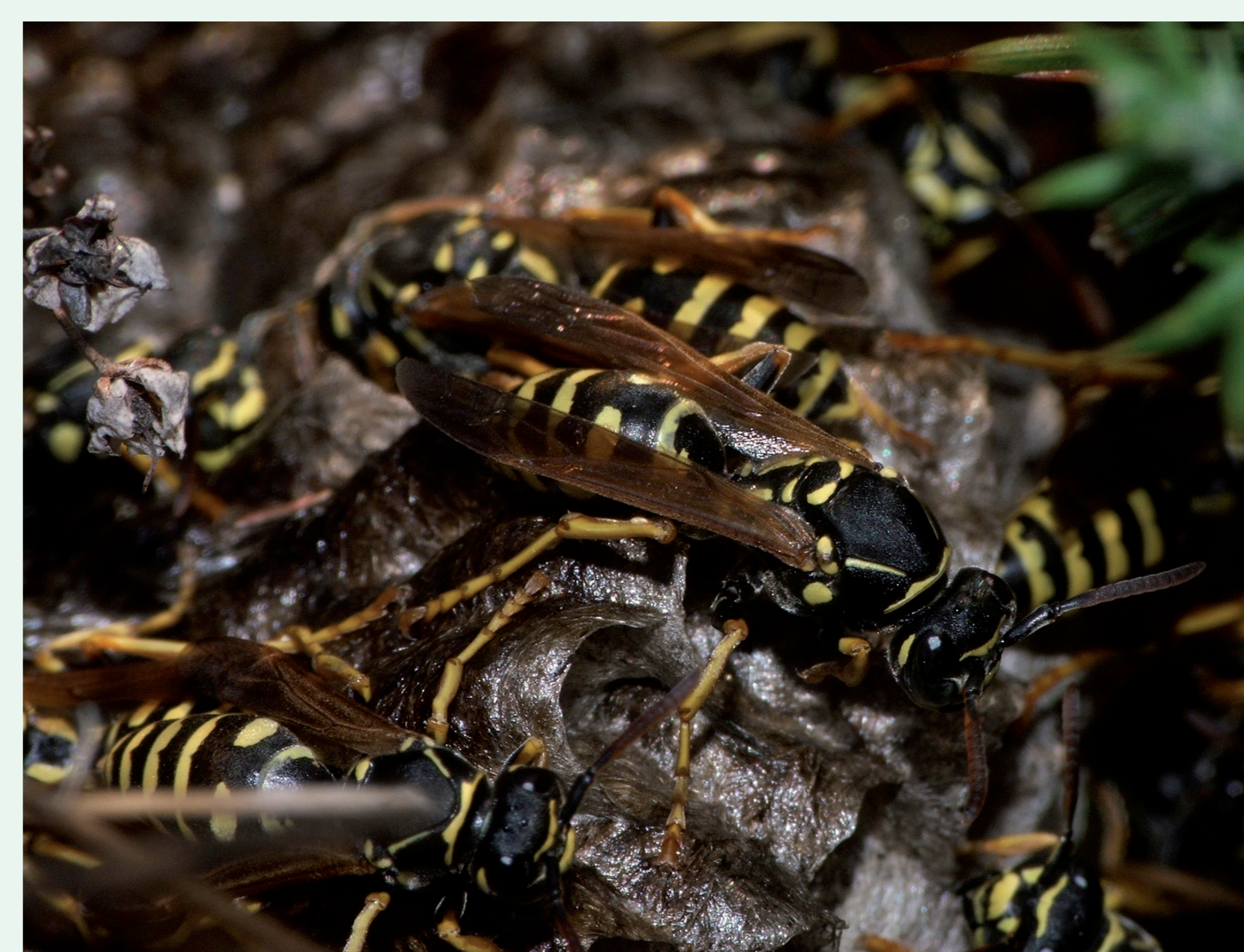
VESPA-DO-PAPEL | Paper Wasp - Polistes sp. Insecta / Hymenoptera / Vespidae

Um ninho de vespa: dentro dos favos estão as larvas que são alimentadas pelas suas irmãs já adultas.