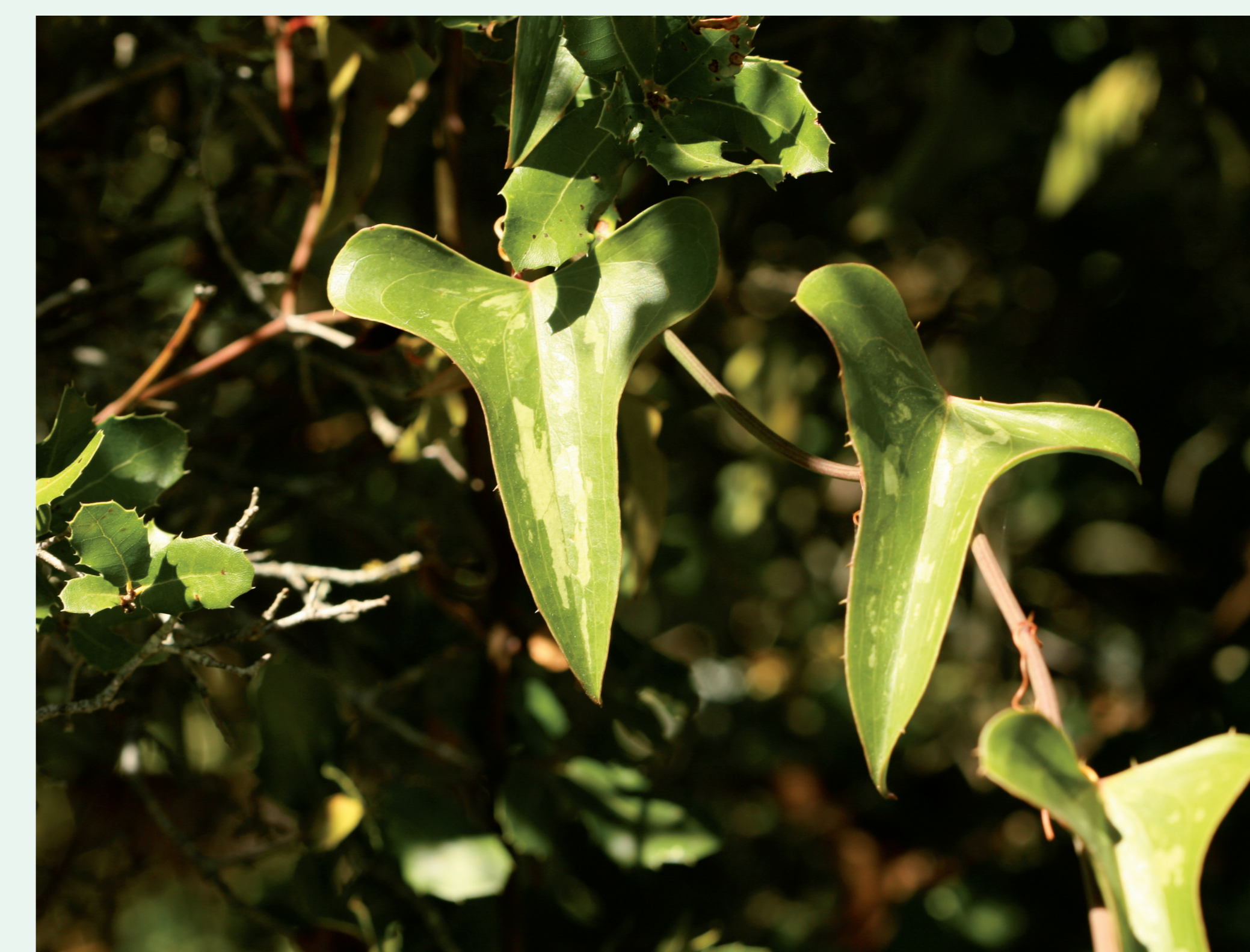
SALSAPARILHA | Rough Bindweed - Smilax aspera Eudicotiledonea / Liliaceae

Peregrina (Latin word which means "pilgrim") because it clings to the clothes of who is passing by and accompanies the pilgrims.