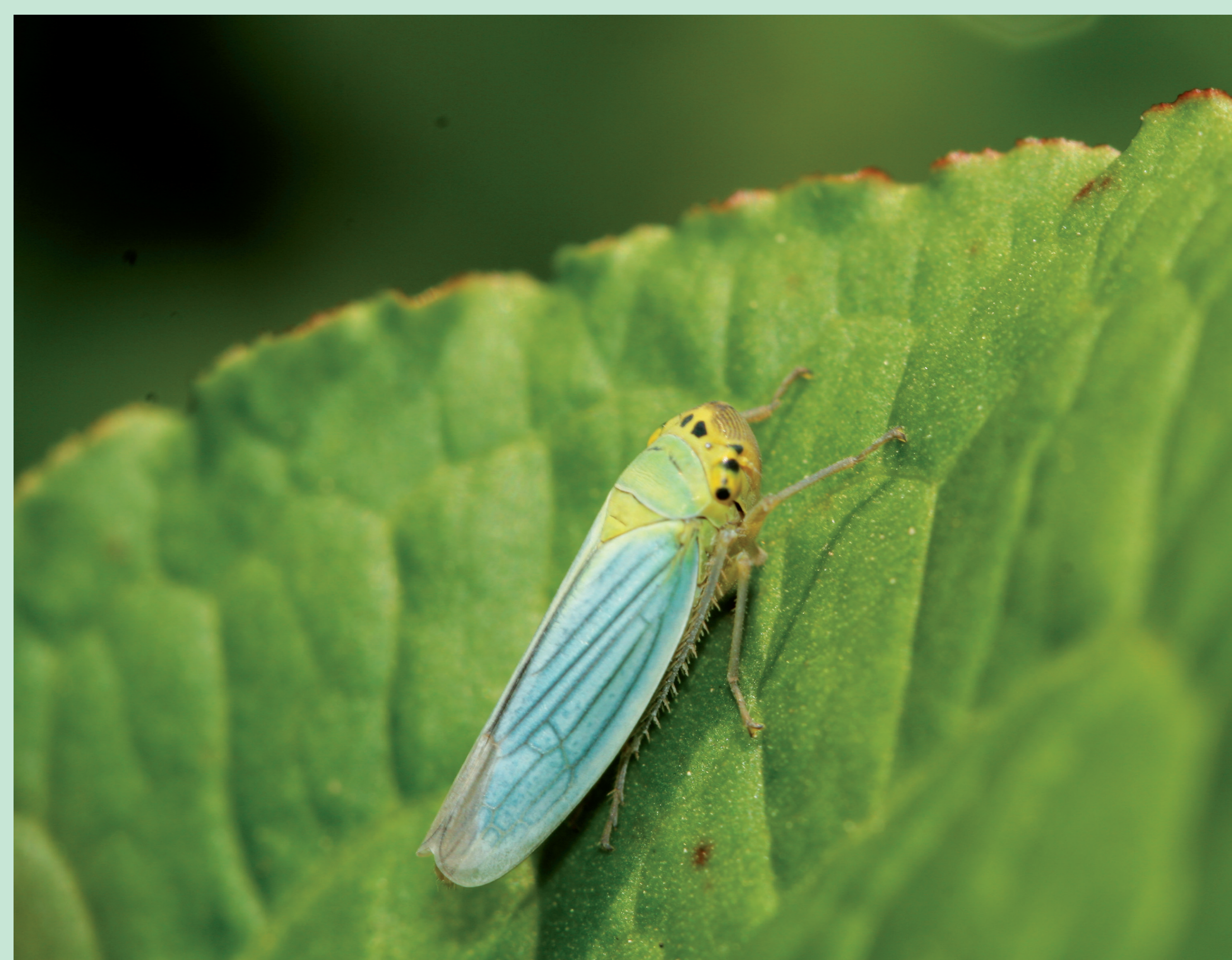
CIGARRINHA | Green Leafhopper - Cicadella viridis Insecta / Hemiptera / Cicadellidae

Difficult to see, the Cicadas are well-known for their singing. Adults live up in the trees sucking the sap from those with a beak-shaped mouth, typical of the Order. To identify the different species of Cicada genus, one uses their singing. At www.cicadasong.eu you can listen to the European Cicadas repertoire.