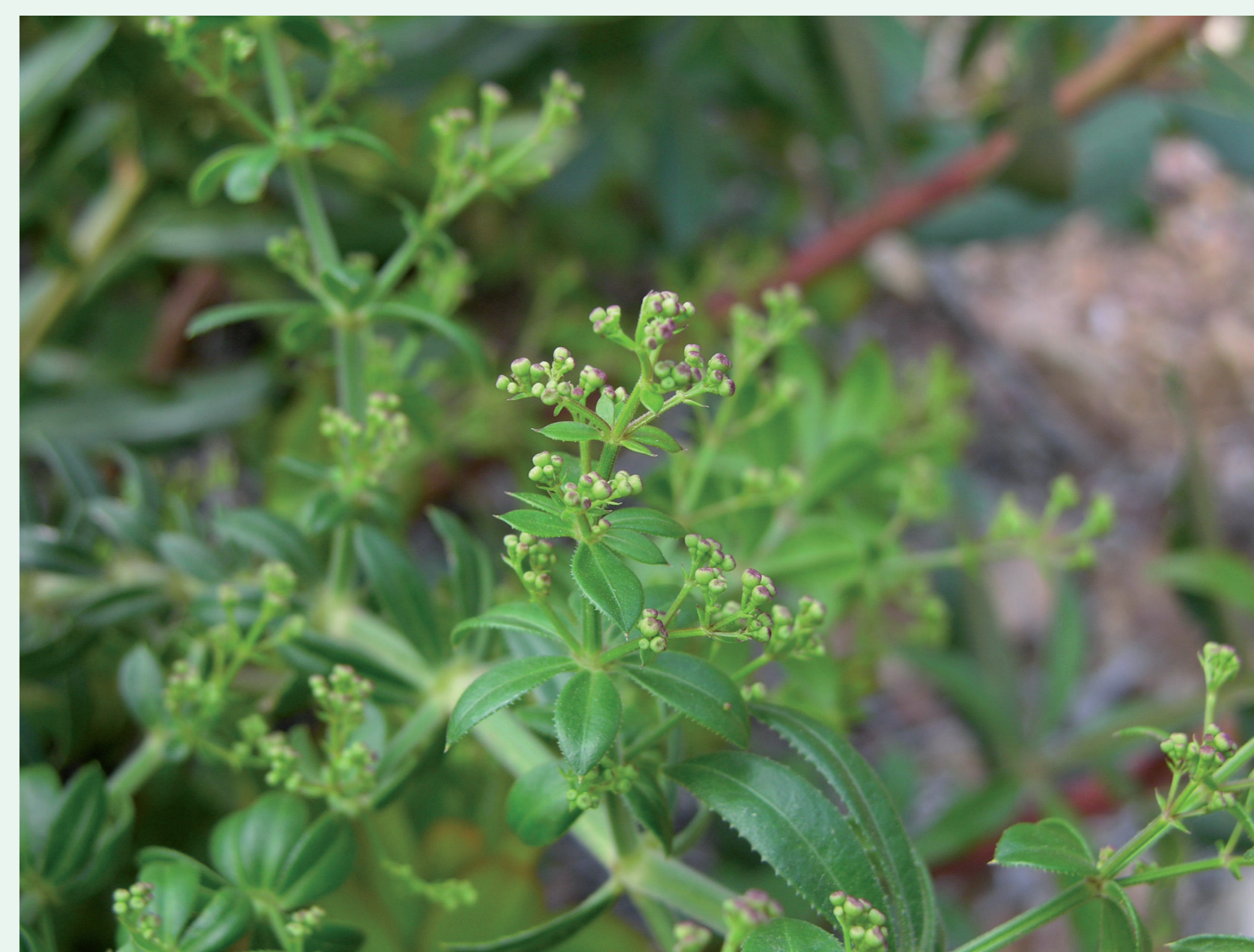
RASPA-LÍNGUA | Wild Madder - Rubia peregrina Eudicotiledonea / Rubiaceae

Peregrina porque se agarra às roupas de quem passa e acompanha a peregrinação.