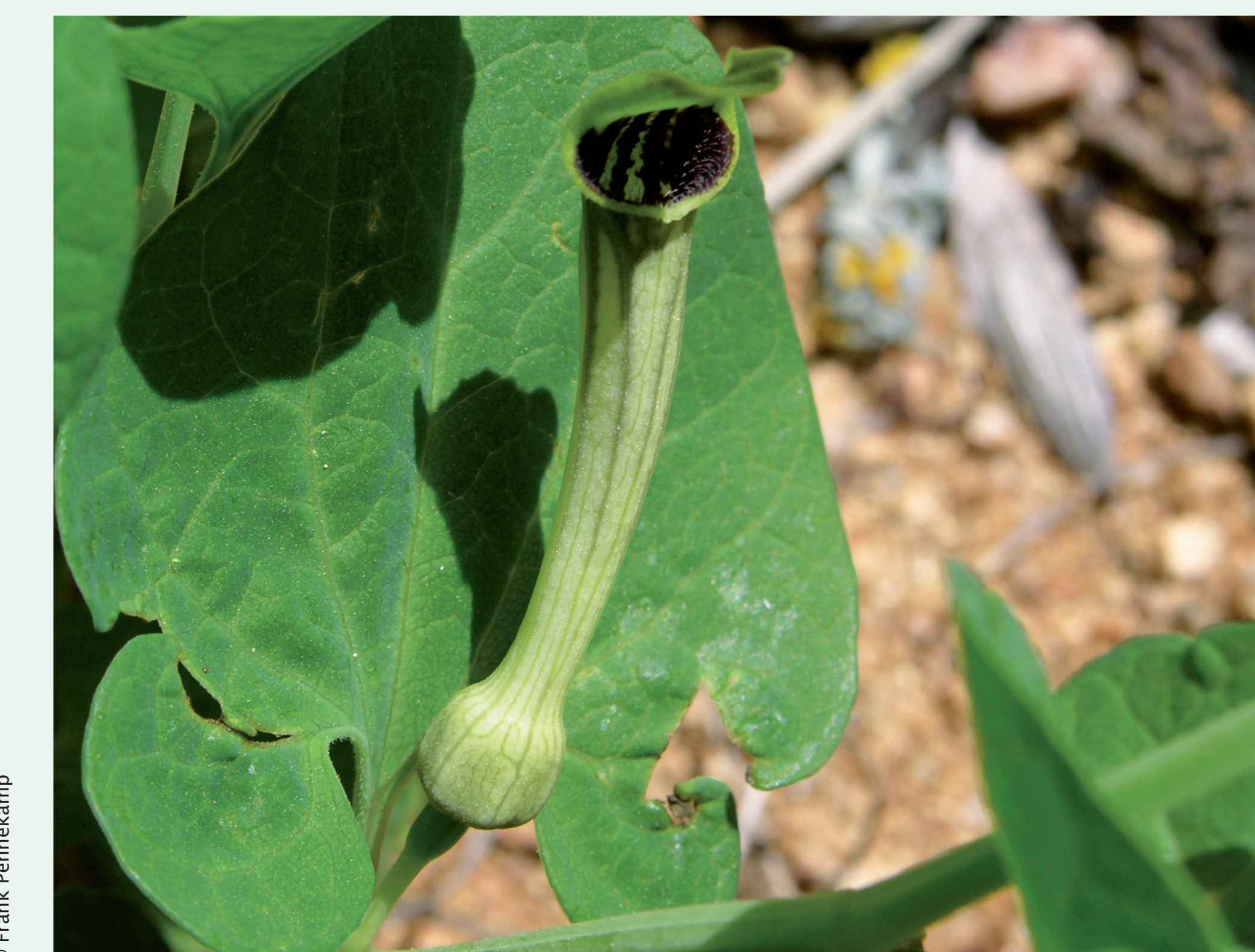
ARISTOLÓQUIA - Aristolochia paucinervis Eudicotiledonea / Aristolochiaceae

Muito venenosa. As suas folhas e curiosas flores servem de alimento à bonita Borboleta-carnaval.