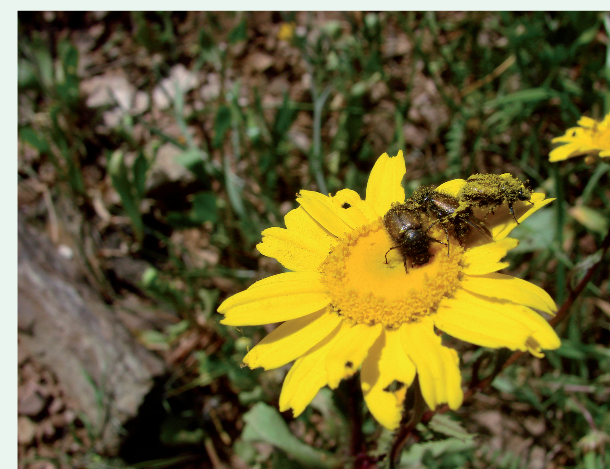
ESCARAVELHO | Beetle - Chasmatoxerus sp. Insecta / Coleoptera / Scarabaeidae

A wasp nest: within the combs there are larvae, which are fed by their adult sisters.