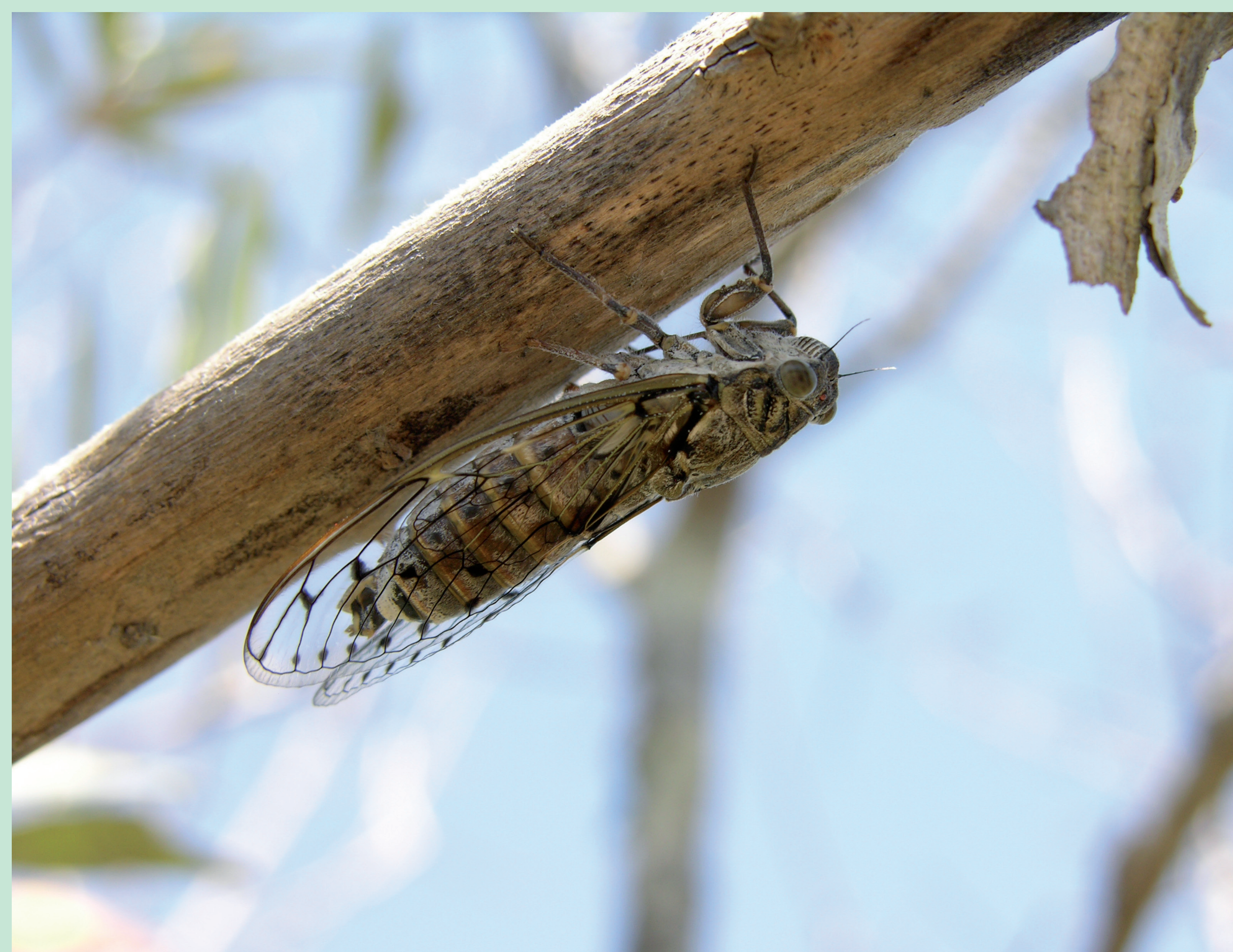
CIGARRA | Cicada - Cicada orni Insecta / Hemiptera / Cicadidae

Difíceis de ver, as cigarras são bem conhecidas pelo seu canto. Os adultos vivem em cima das árvores cuja seiva sugam com a boca em forma de bico característica da Ordem. Para identificar as diferentes espécies do género Cicada é usado o canto. Em www.cicadasong.eu pode ouvir o relatório das cigarras europeias.