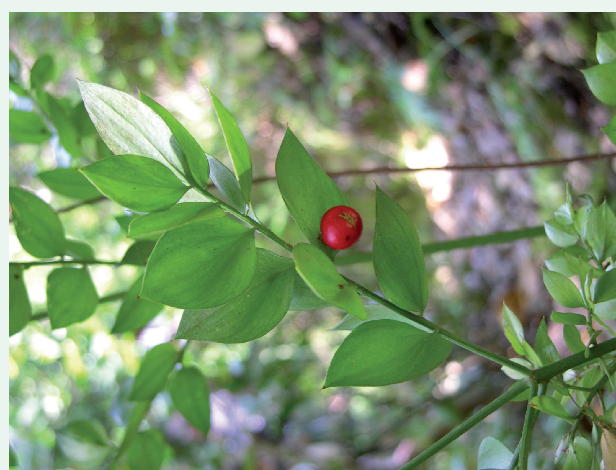
GILBARDEIRA | Butcher's Broom - Ruscus aculeatus Monocotiledonea / Asparagaceae

Espécie protegida pelo anexo II da Directiva habitats.