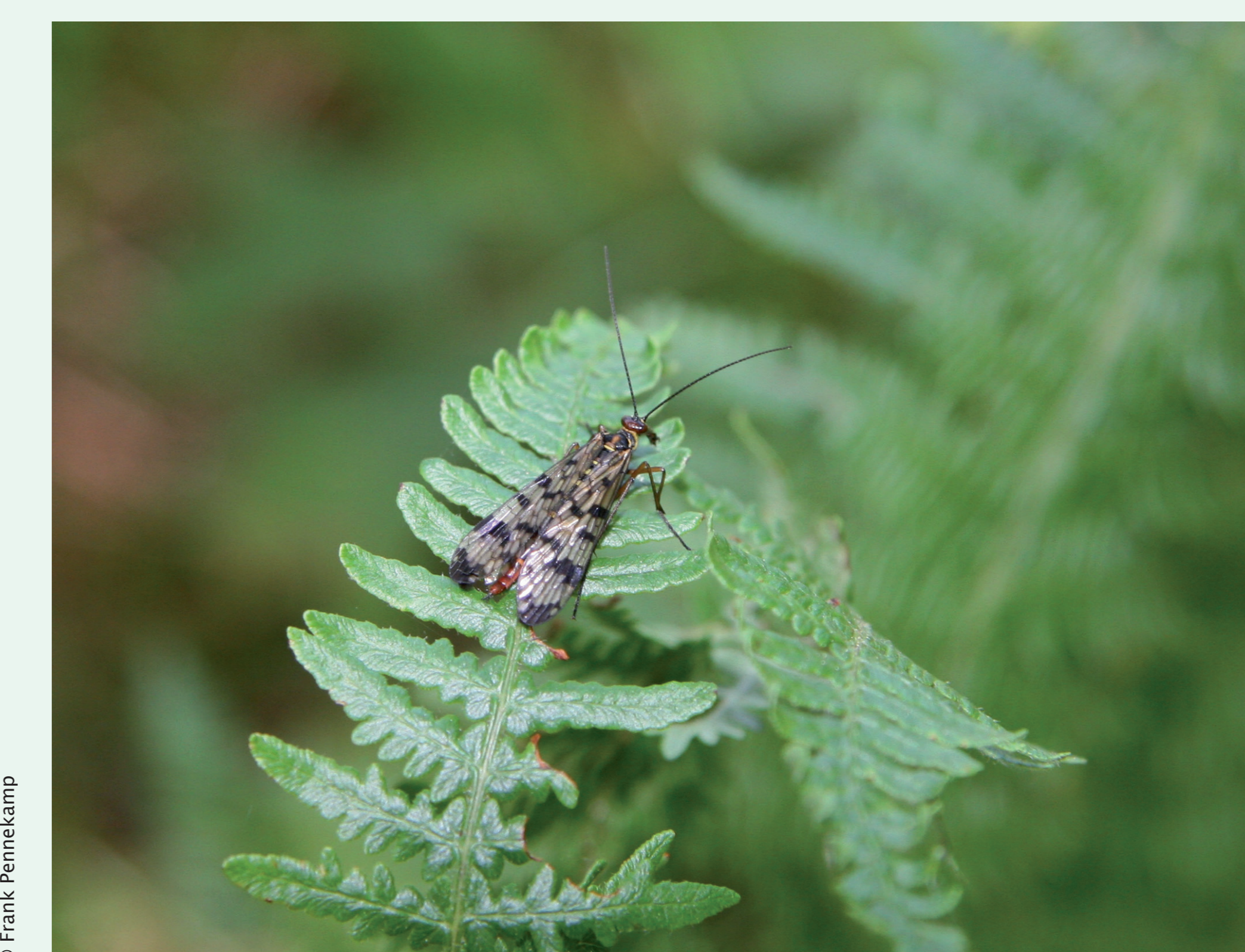
MOSCA-ESCORPIÃO | Scorpionfly - Panorpa sp. Insecta / Mecoptera / Panorpidae